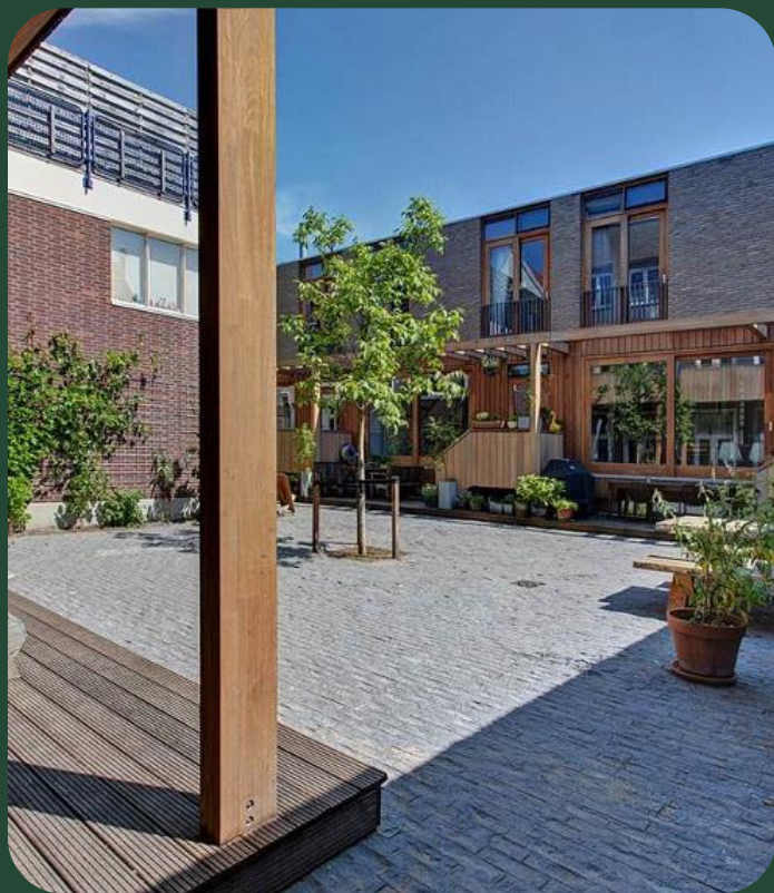
Hof van Eland